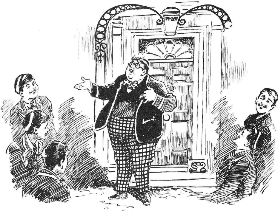
Bunter the Future Prime Minister