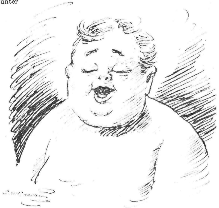
Bunter the Toddler