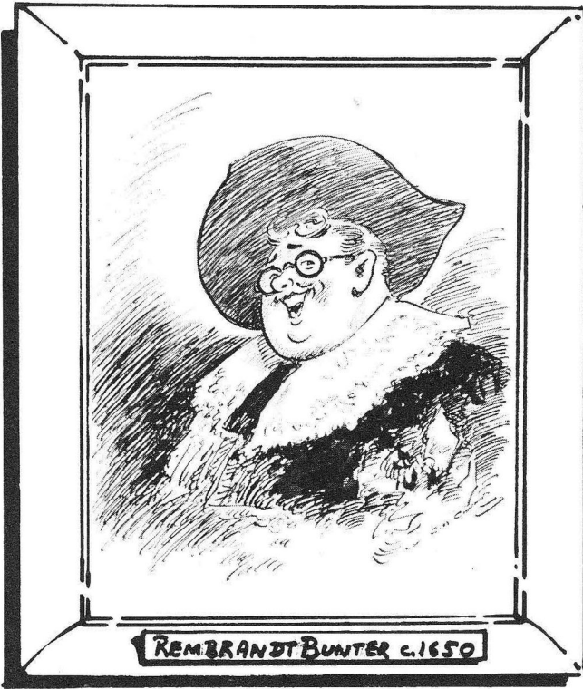
REMBRANDT BUNTER C. 1650