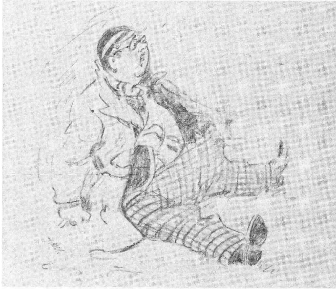
Bunter the Adolescent