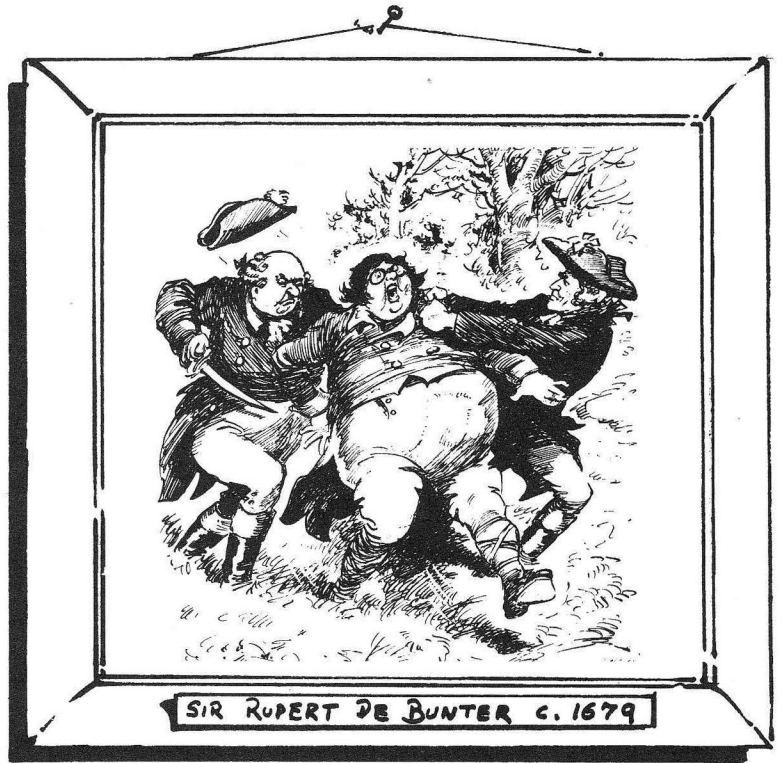
SIR RUPERT DE BUNTER C. 1679